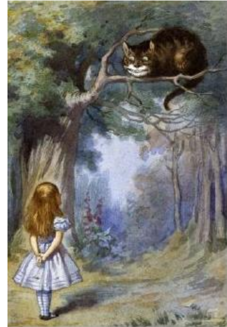
Lewis Carrol, 1865

-Entonces, poco importa el camino que tomes –replicó el Gato.